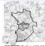
ORIENTACJA 1:100 000