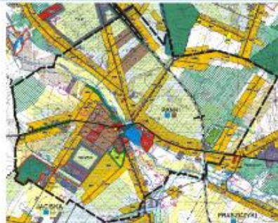
STUDIUM STRATEGICZNEGO I WYKONANIE STUDIUM WYKONAWCZEGO W ZAKRESIE PLANOWANIA PRZESTRZENNEGO WYKONANO W 2010 ROKU