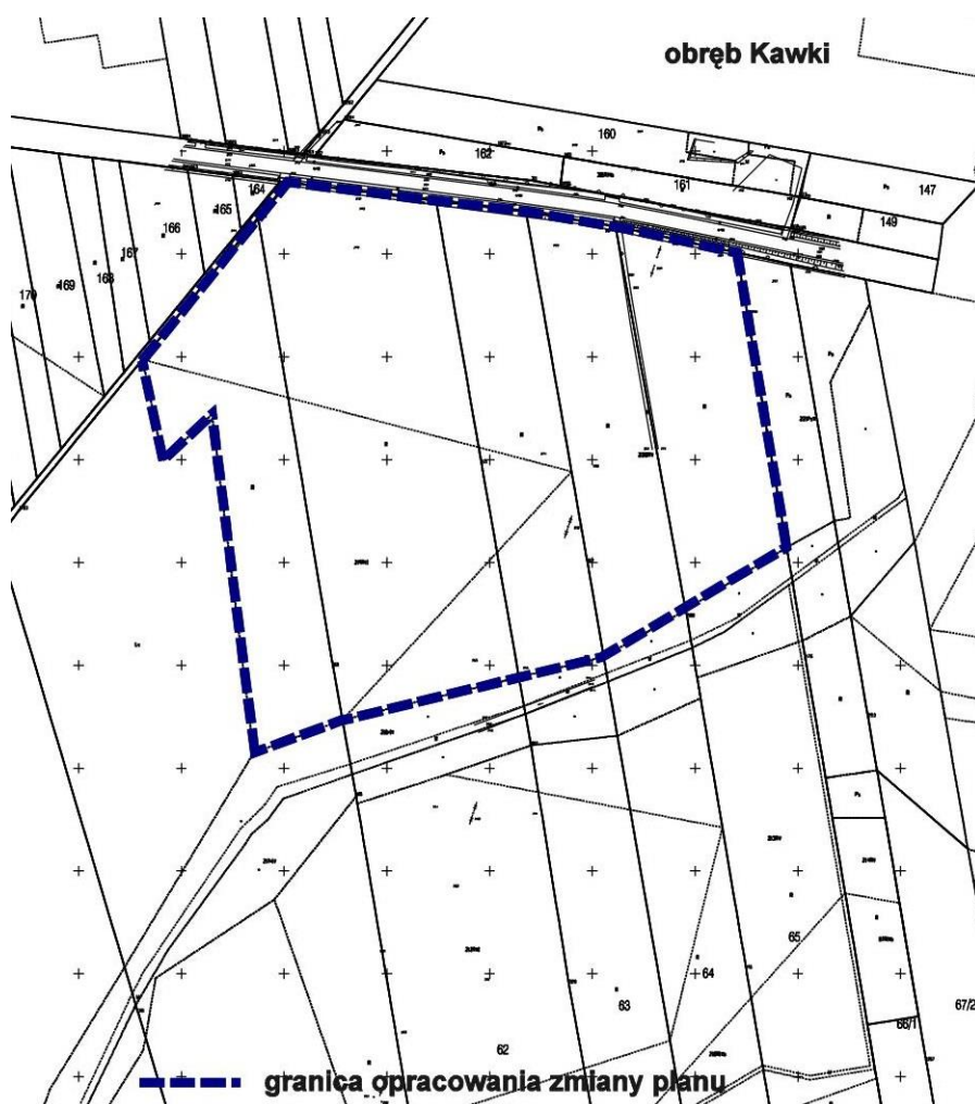
Rys. 1. Granica obszaru którego zmianą planu dotyczy

Obszar, którego zmiana planu dotyczy, położony jest w północno-zachodniej części województwa śląskiego, w powiecie kłobuckim w gminie Panki. Zmiana planu dotyczy terenu części działek nr 61, 62, 63, 64, 65 w obrębie Kawki.